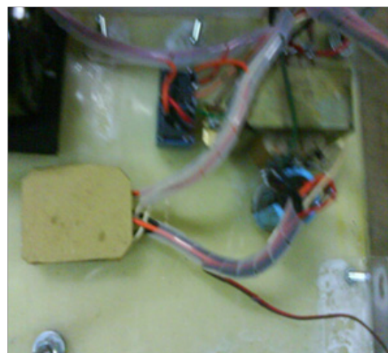
Gambar 3. Desain motor dengan gearbox dan penjepit kapsul amalgamator