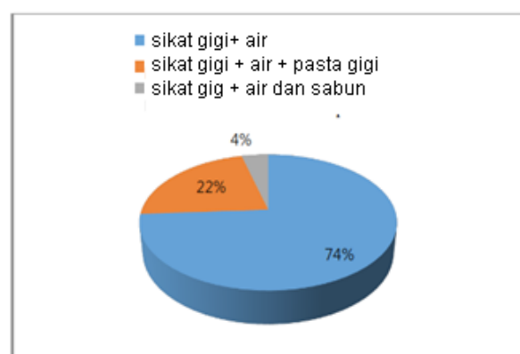
Gambar. Metode dan bahan yang biasa digunakan untuk membersihkan GTL. 6